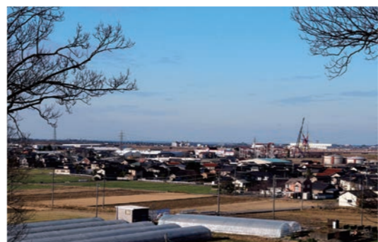
ごうぶん ちやうじやう 1号墳の頂上からのながめ

ぜんちょう たか あきつねやま 全長140m、高さ20mの秋常山1号墳。古代人になったつもりでのぼってみよう。