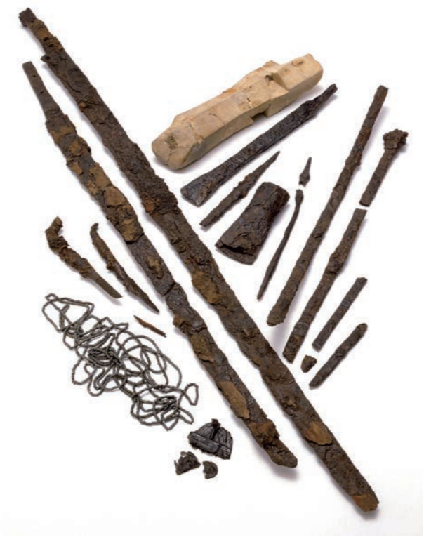
2号墳からの出土品

出土品は、能美ふるさとミュージアムにあるのだ。古墳と合わせて見るとよくわかるのだ。