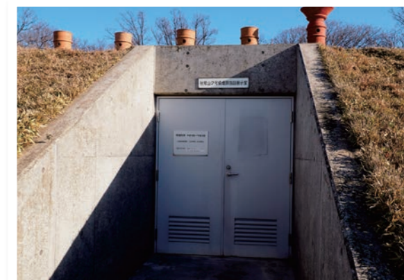
ごうぶん てんじしつ いぐち 2号墳の展示室入り口のドア

てんじしつ あ なか はい 展示室のドアを開けて中に入ると、古墳の説明と埋葬施設が復元されている。必見だ!