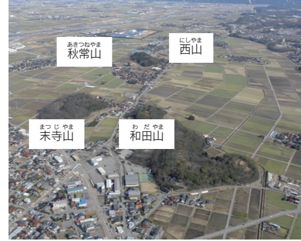
空から見た能美古墳群

手取川の扇状地の田んぼや住宅の中に小高い丘が並んでいるのだ。3～6世紀終わりごろにかけての約350年間で、ここに古墳がつくられたのだ。