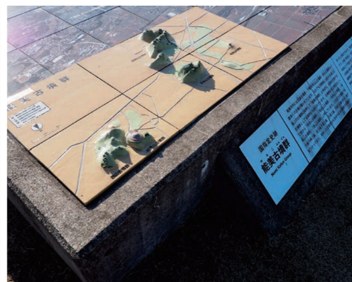
のみ こふんぐん あんないばん 能美古墳群の案内板

ごうぶん ちやうじやう はにわ ふくけん 2号墳の頂上には埴輪(復元)が並び、この下には、展示室がある。2号墳からは和田山古墳群と末寺山古墳群が目の前に見える。