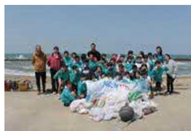
加賀舞子海岸清掃