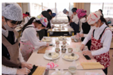
収穫祭の飾り巻き寿司作り