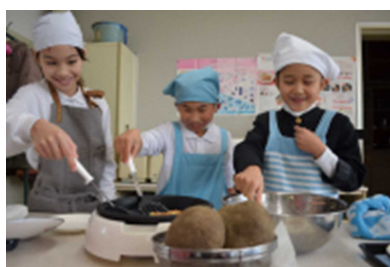
丸いもお好み焼き作り