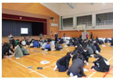
SDGs 根上子どもサミット